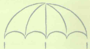
het symbool het pictogram de cartoon